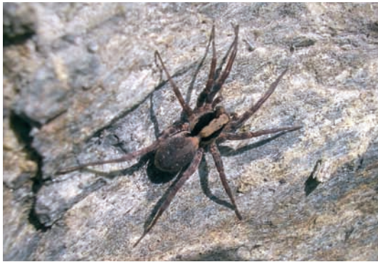
Abb. 5: Xerolycosa nemoralis ♀