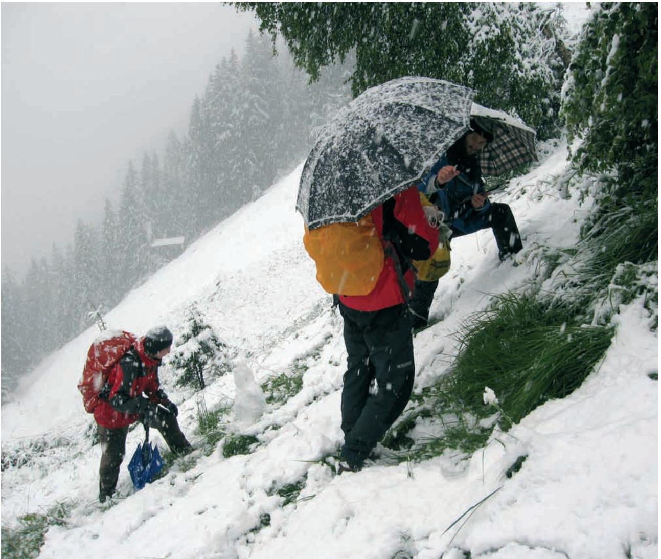
Abb. 1: Erhebungen unter erschwerten Bedingungen.