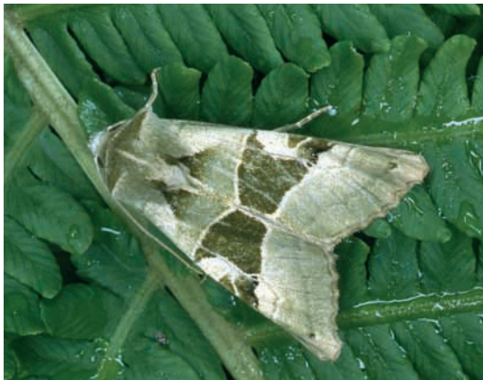
Abb. 4: Adlerfarn- oder Smaragdeule ( Phlogophora scita ), eine in Tirol sehr selten nachgewiesene Art.

vom Verfasser dieses Artikels in die Besonderheiten des Gebietes eingewiesen. Auf den ausgegeben Blättern mit Luftaufnahmen des Gebietes wurde eine grobe „Platzverteilung“ vorgenommen, um sicherzustellen, dass die Untersuchungen das Gebiet flächenmäßig möglichst umfassend abdecken und die Vielfalt der Lebensräume so vollständig wie möglich erfasst wird. Trotz des sehr schlechten Wetters war die Begeisterung der Teilnehmer ungebrochen und das erzielte Ergebnis ist daher beachtlich. Die Studien begannen am Abend des 17. Juli mit einer ausgedehnten Lichtbeobachtungsaktion. Sie fanden in einer Höhe zwischen 800 und 1800 Metern statt. Am folgenden Tag wurden Tagbeobachtungen angeschlossen, trotz Dauerregens und Schneefall bis an den Ortsrand von Brandberg (ca. 1000 m).