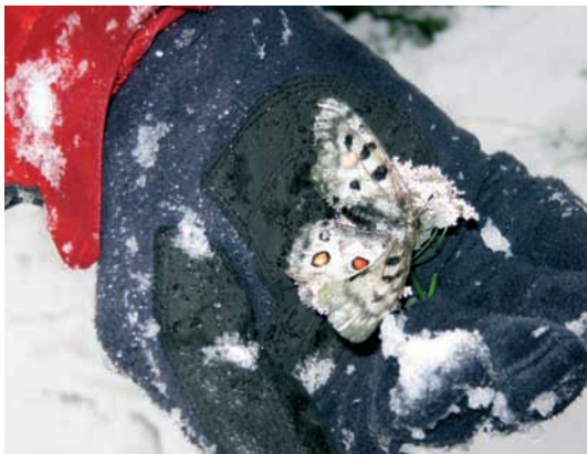
Abb. 3: Ein unter der Schneedecke gefundener Apollo Falter ( Parnassius apollo ).