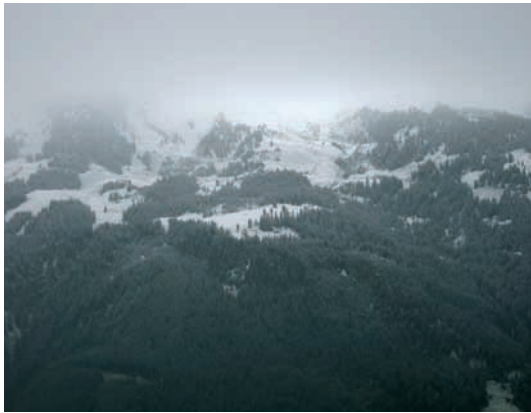
Abb. 2: So präsentierten sich die Zillertaler Alpen am Hauptaktionstag.