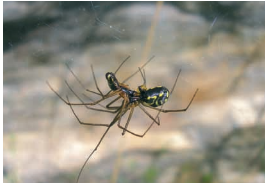
Abb. 6: Neriene radiata , ♂ ♀ in Copula

Diese ursprünglich aus N-Amerika stammende Zwergspinne ist nach dem erstmaligen Fund in Deutschland 1976 rezent in Mitteleuropa in massiver Expansion begriffen und z. B. in Vorarlberg und Südtirol im offenen Gelände ohne besondere